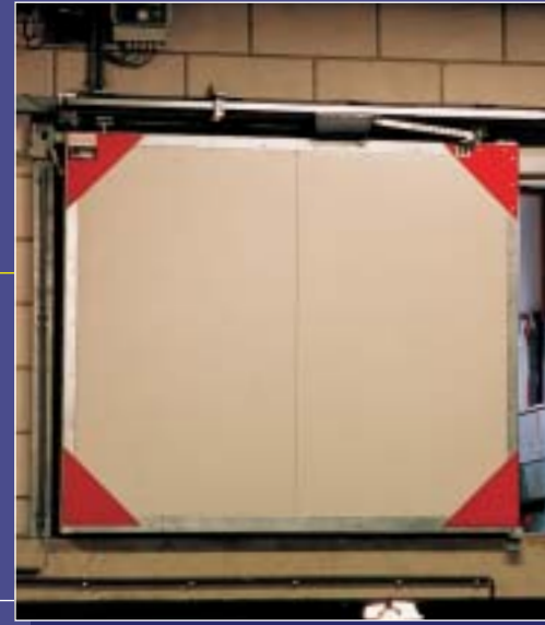
6.02 60 min.