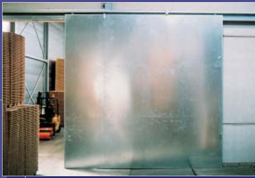
6.01 120 min.